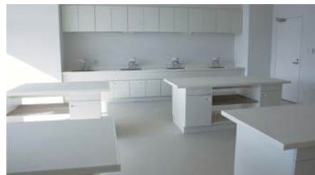
調理もできる講習室