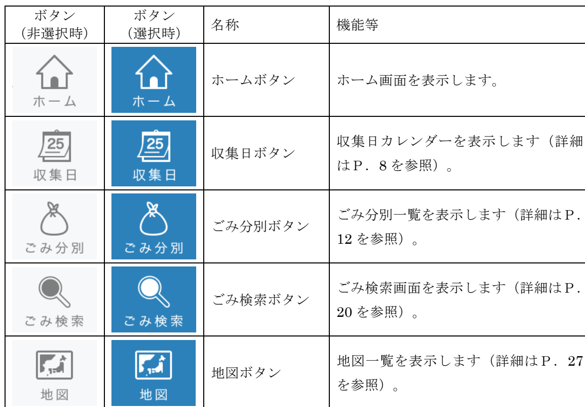
【メニューバーの各ボタンの名称と機能】