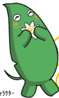
大和市イベントキャラクター ヤマトン