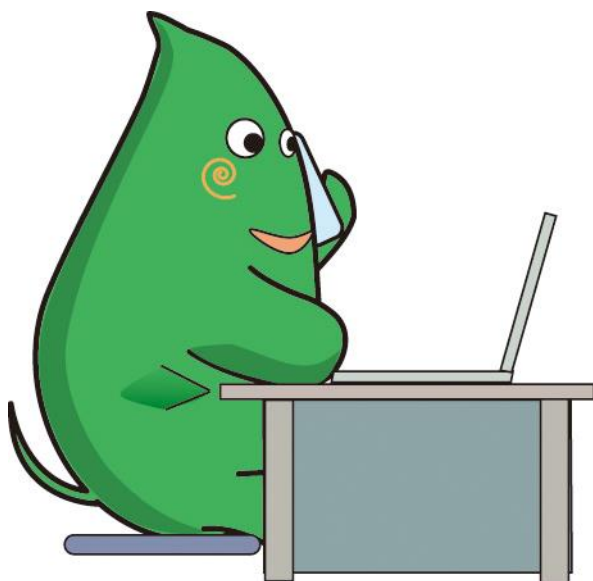
大和市イベントキャラクター「ヤマトン」