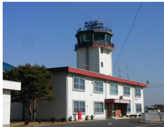
【現在の厚木基地の管制塔】