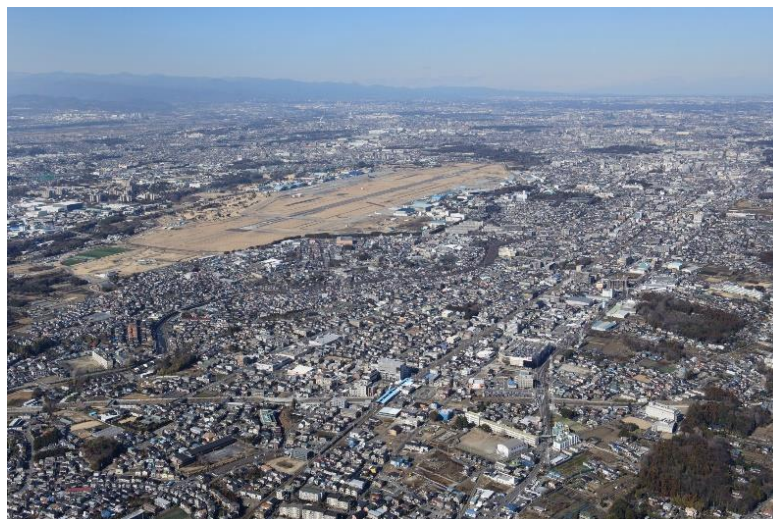
【滑走路の延長線上に広がる大和市の住宅密集地域】