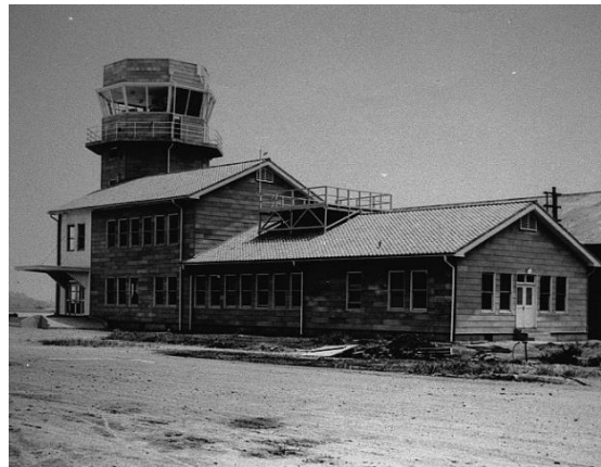
【1946年（昭和26年）頃の厚木基地の旧管制塔】