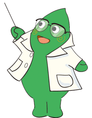
大和市イベントキャラクター ヤマトン