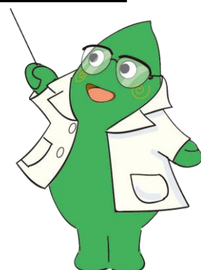
大和市イベントキャラクター ヤマトン