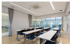
【生涯学習センター】