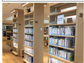
健康に関する図書コーナー