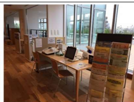
健康度見える化コーナー