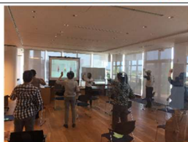
健康テラス(健康講座)