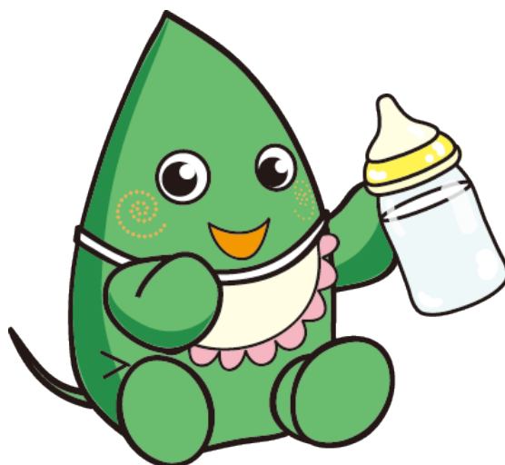
大和市イベントキャラクター ヤマトン