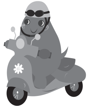
大和市イベントキャラクターヤマトン