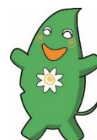
大和市イベントキャラクター 「ヤマトン」