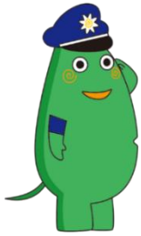
大和市イベントキャラクター「ヤマトン」

サギ被害が急増しています。 受信時に警告メッセージが流れ会話を自動で 録音できる電話機を購入しませんか？