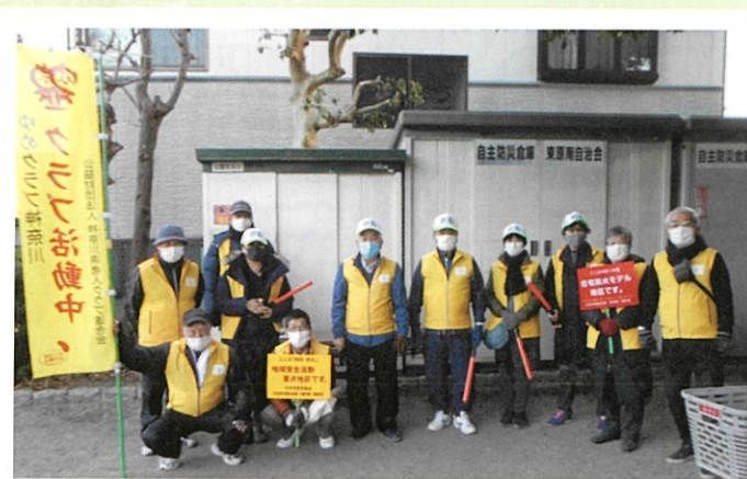
「年末防犯・防火パトロール」

令和2年9月の発足式を皮切りに、防犯・防火講習会、年末防犯・防火パトロールなど、地域住民参加による様々な事業を実施することで、地区内の防犯・防火意識の高揚、活動の活性化を図りました。ご協力いただきました皆様、ありがとうございました。