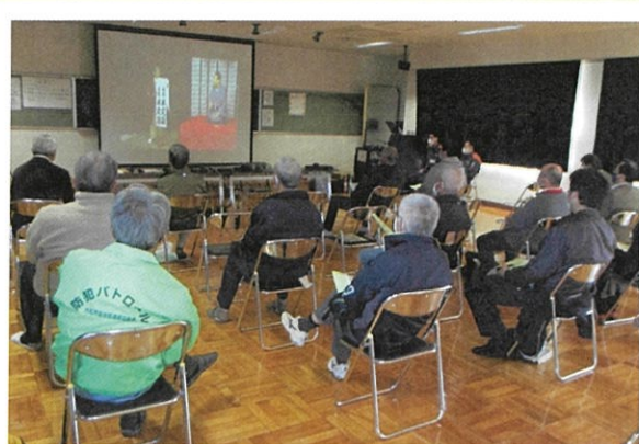
「防犯・防火講習会」