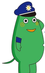
大和市イベントキャラクター「ヤマトン」

サギ被害が増えています。 通話内容の録音や怪しい番号からの着信を 拒否できる電話機を購入しませんか？