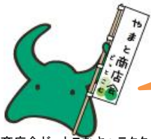
やまと商店会どっこむキャラクター ヤマベ

市では、商業振興に関する施策を総合的、計画的に推進するために、平成25年度に商業戦略計画の策定を行います。関係者の皆様のご意見をお待ちしています。