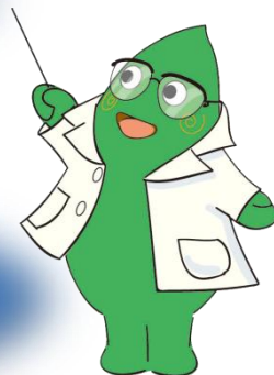
大和市イベントキャラクター ヤマトン