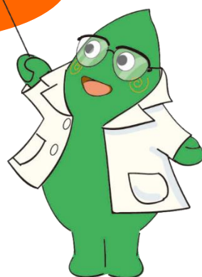
大和市イベントキャラクターヤマトン