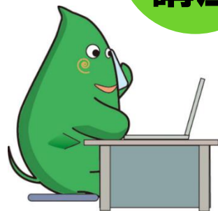
大和市イベントキャラクターヤマトン

若年者や就業経験の少ない方を対象とした就職支援セミナーです。 ワードやエクセルの基礎を学び、仕事で使えるパソコンスキルを身に着けます。 経験豊富なキャリアカウンセラーによる個別相談や応募書類の添削も行います。 初めてワード・エクセルを使う方も丁寧にサポートしますので是非ご参加ください。