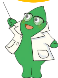
大和市イベントキャラクター ヤマトン