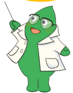
大和市イベントキャラクター ヤマトン