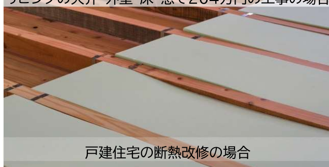
戸建住宅の断熱改修の場合

たとえば 68万円 を補助 リビングの天井・外壁・床・窓で204万円の工事の場合