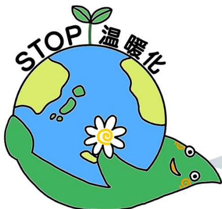
大和市気候非常事態宣言ロゴマーク

みなさんが取り組んだことを、市内に住む人全員で行えば、 目標に大きく近づくことができます!