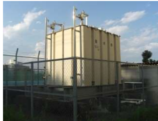
（鋼板製・一体型・屋外設置）