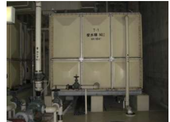
（FRP製・パネル型・屋内設置）