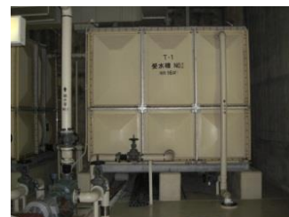
（FRP製・パネル型・屋内設置）