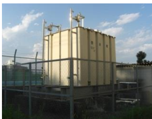
（鋼板製・一体型・屋外設置）