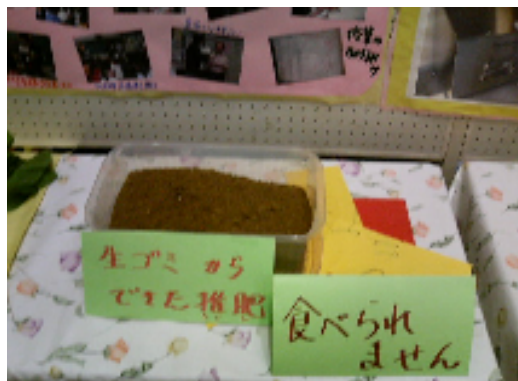
なま たいひ てんじ 生ごみ堆肥の展示