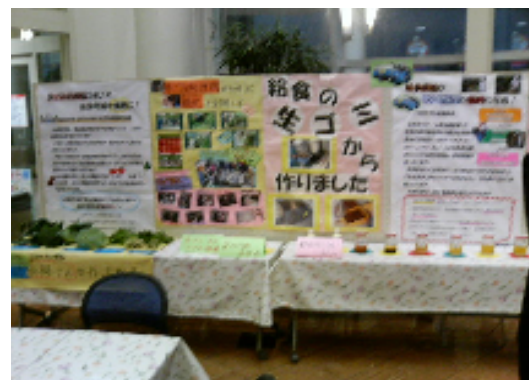
しげんじゅんかん どう かん てんじ けいはつ 資源循環システム等に関する展示・啓発