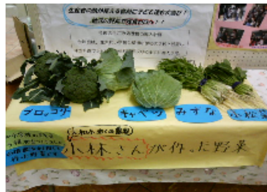
なま たいひ かつよう のうさくぶつ てんじ 生ごみ堆肥を活用した農作物の展示