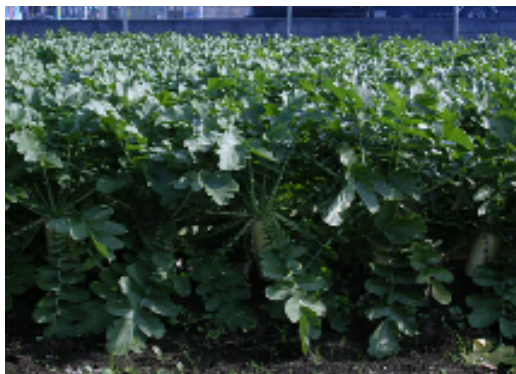
学校給食残渣を堆肥として利用し 育てただいこん