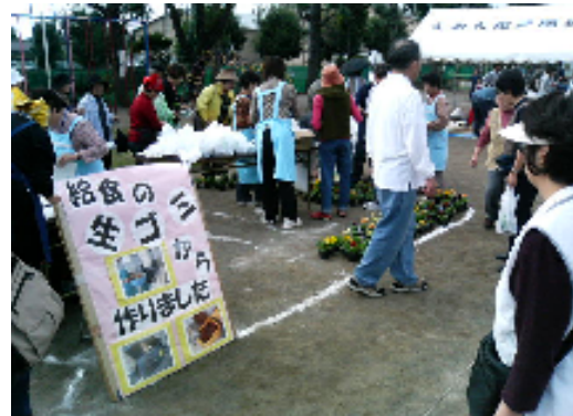
なま 生ごみ たいひとうはいふ 堆肥等配布コーナー