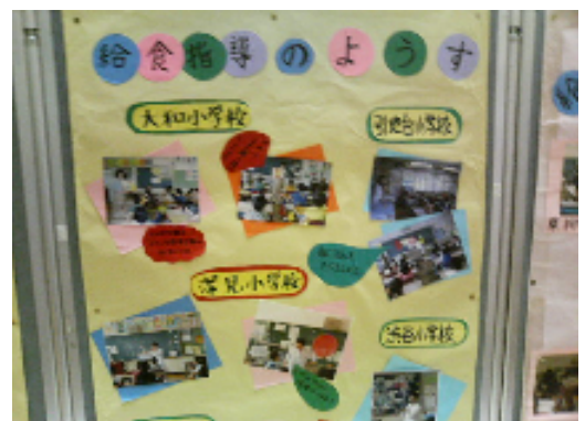
かくしょうがっこう きゅうしょくしどう ようす 各小学校での給食指導の様子