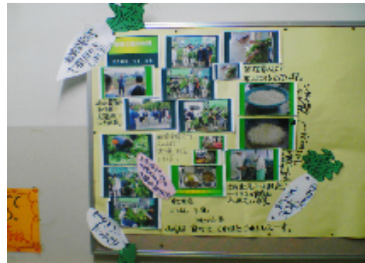
資源循環システムの活動の 教室内掲示