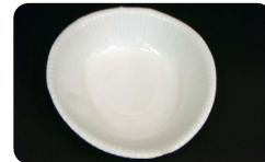
紙皿、紙コップなど