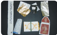
ティーパックの個袋、割箸の袋、お菓子の個袋など