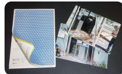
圧着ハガキ、写真、写真ハガキなど