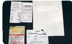
レシート、FAX用紙、ATM利用明細など