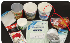
紙 のあるヨーグルト・アイスの容器、お酒のバック、カップめんの容器・ふた、ジュースのバック、タバコの銀紙、スナック菓子の容器など