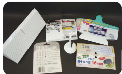
電池などの台紙、綿棒の底の紙など