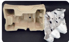
卵の紙製容器、電化製品の緩衝材など