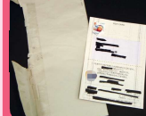
封筒の糊付けや、宛名シールは、切り取ったりしない。その他の紙は「その他」の紙に入れてください。