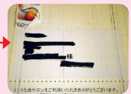
個人情報がある場合は、切り取るか、ぬりつぶしてください。