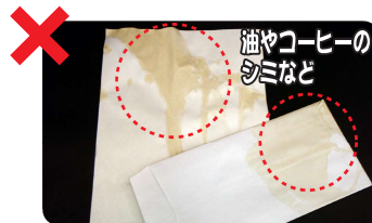
汚れが浸みこんでいる場合、汚れが落ちない場合は、燃やせるごみとして出してください。