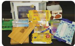
お菓子の箱、食品・飲料の箱、ティッシュの箱、お土産の箱など