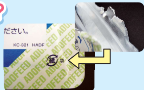
カップめんの容器で、紙製のものです。