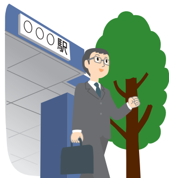
一駅手前で下車して歩く