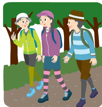
仲間とハイキングを楽しむ など