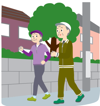
少し遠くまで散歩する