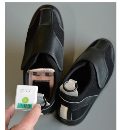
靴底にGPSを入れて正確な位置を把握

問い合わせは▶保健福祉センター高齢福祉課高齢福祉担当 ☎046-260-5611 FAX 046-260-1156。