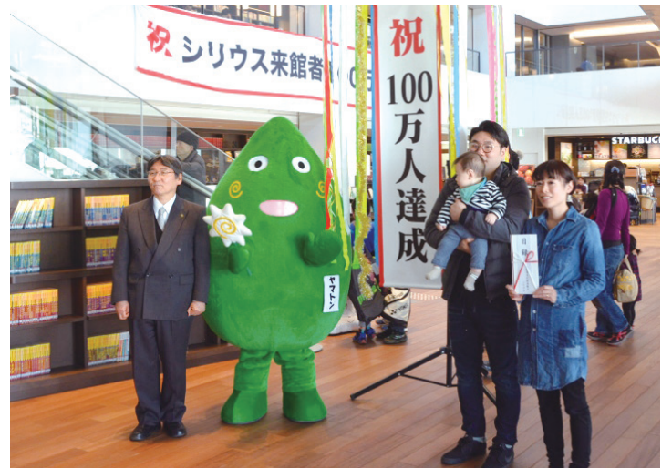
オープンから135日目の3月17日には、来館者100万人を達成し、記念式典が開催されました