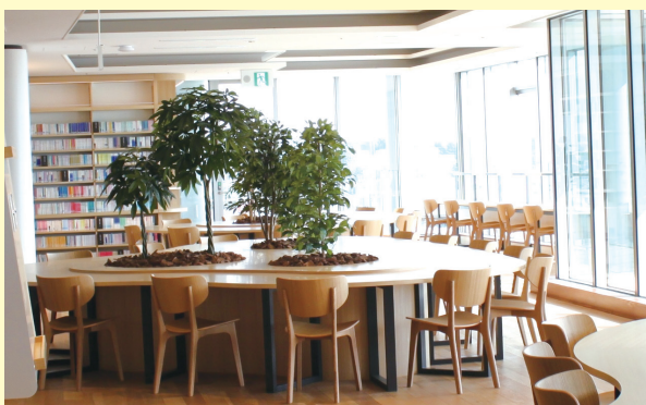
各フロアごとにさまざまな閲覧席を用意