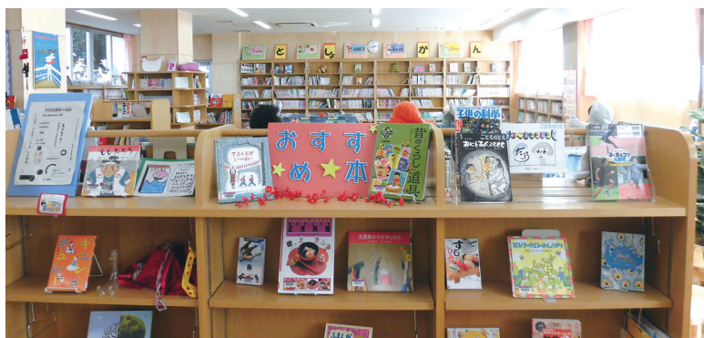
リニューアルされた図書館

文ヶ岡小学校は、図書館のリニューアルや授業での図書館の積極利用などの取り組みが評価され、4月に表彰されました。