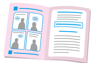
左ページに4コマ漫画を、右ページに詳しい情報を掲載