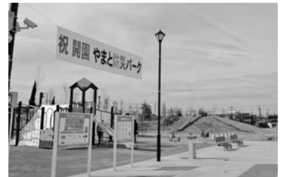
今年3月に開園した「やまと防災パーク」

南林間六丁目の大和園跡地(1.22㍍)に、防災機能を備えた公園「やまと防災パーク」を開園。公園内には芝生広場をはじめ、ボール遊びもできるエリアや複合遊具などを整備しました。