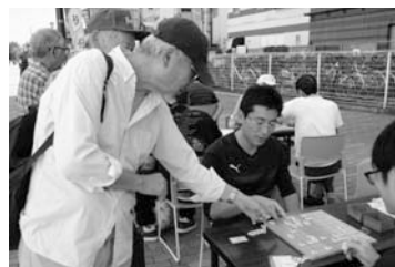
多くの人でにぎわった青空縁台将棋

世代の人が交流できる場にするため「青空縁台将棋」を開催。また、市制60周年を記念して「大和市健康将棋大会」をポラリスで開催しました。