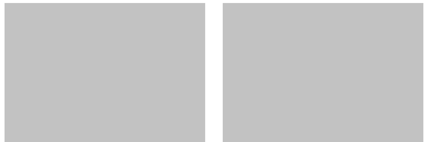
大和市は自主財源を確保するため、「広報やまと」に広告を掲載しています。

梅雨が明けて急に暑くなる時期は体が暑さに慣れていないため、熱中症になりやすくなります。また、熱中症の発生は7～8月がピークです。高齢の人や乳幼児は特に注意が必要です。屋内、屋外を問わず注意しましょう / 熱中症を予防するポイント ▶のどが渇いていなくても水分をこまめに取る、無理にエアコンを制限しない、食事・睡眠を十分に取って体調を整える、外出時には日傘や帽子を使用し、こまめに休憩する。