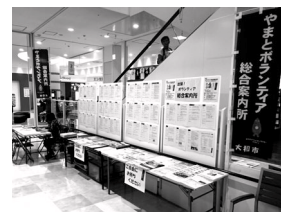
市内のボランティア活動の情報が得られます

市役所市民活動課協働・ボランティア・県人会・市民活動支援係 ☎(2660)5103 FAX(2660)5138