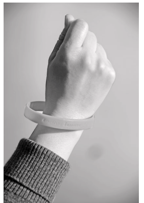
認知症サポーター養成講座の受講者に配付される「オレンジリング」

保健福祉センター高齢福祉課 認知症策推進係 ☎(2660)5612 FAX(2660)1156