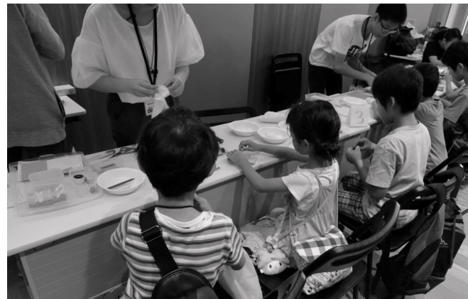
さまざまな体験ができます

市教育委員会教育研究所教育研究係 ☎(2660)5213 FAX(2660)9832