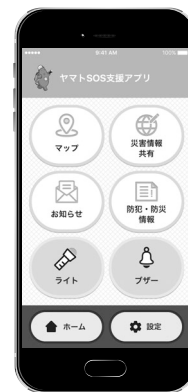
スマートフォン用の「ヤマトSOS支援アプリ」

ヤマトSOS支援アプリ ▶ オフラインでも避難先などの場所や経路などを確認できます。やまとPSメールの内容も確認できます。