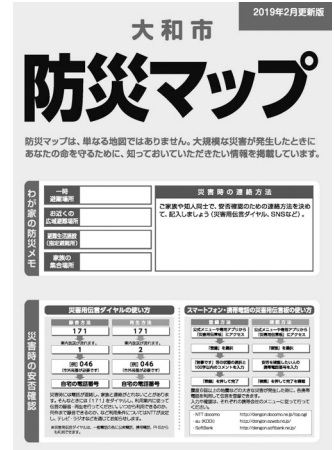
防災の情報をまとめたマップ

災害により、自宅が損壊し生活できなくなった人などが一時的に生活する施設。災害の状況により市が開設します。市内の市立小・中学校、高校などの33か所を指定しています。