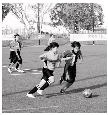
白熱した試合を繰り広げます

市は、未来の「なでしこジャパン」を目指す女子小学生のサッカー大会「大和なでしこカップ2019(U-12)」を開催します。県内外全12チームで優勝を争います。熱戦にご期待ください。 とき▼11月30日(土)、12月1日(日)いずれも午前9時30分～午後4時30分(予定) ところ▼大和なでしこスタジアム(大和スポーツセンター競技場) 観戦申し込み▼不要。