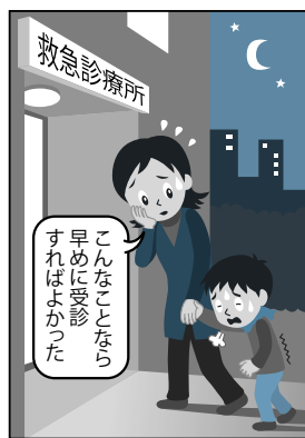
夜間の外出は症状を悪化させることも

ふだんから自身の健康状態を把握してくれる「かかりつけ医」を持ち、できるだけ早めに、診療時間内(昼間)に受診しましょう。早めの受診は重症化を防ぐことにもつながります。また、救急医療機関にかかるため寒