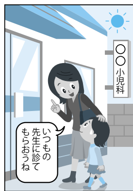
早めにかかりつけ医を受診すると安心です