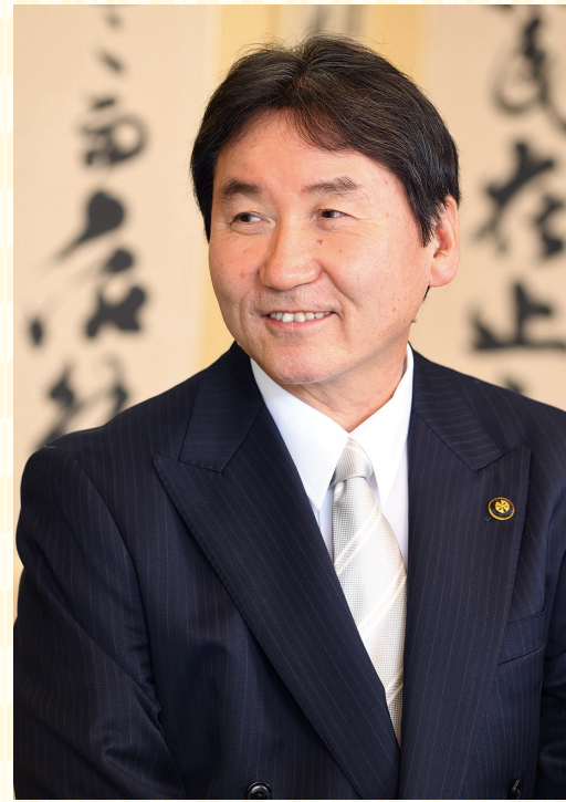
大和市長 大木 哲