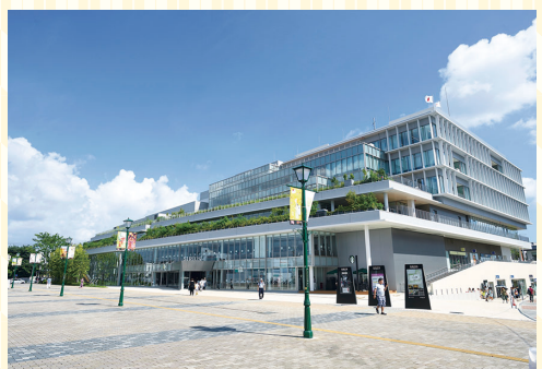
連日多くの人でにぎわうシリウス

ね。私が最初に就いた検察官という仕事は非常に厳しい仕事でした。事件が起きたら「日曜だから捜査しませぬ」なんて言えないので、休暇なんか実質取らないという時代もありました。そういう厳しい仕事をしてきた先輩たちが定年になって急に辞めるじゃないですか、すると皆長生きしなかった。よく言われましたよ、激しい運動をした人がクールダウンしないでいきなりやめると体に悪いって。人生だって同じことですよ。一所懸命やってきた人は一所懸命やった分だけいろいろ