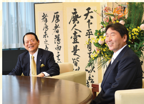
和やかな空気の中、笑顔で語る2人

また、通常ですと会議室みたいなところで事前申込制でやると思いますが、シリウス4階の健康テラスで、当日自由に参加できるようにしたのもよかつたと思います。シリウスには年間300万人を超えるかたがたが来館されますが、健康テラスはガラス張り、エスカレーターのすぐ近くなので皆さんその前を通るんですね。そうすると何かや