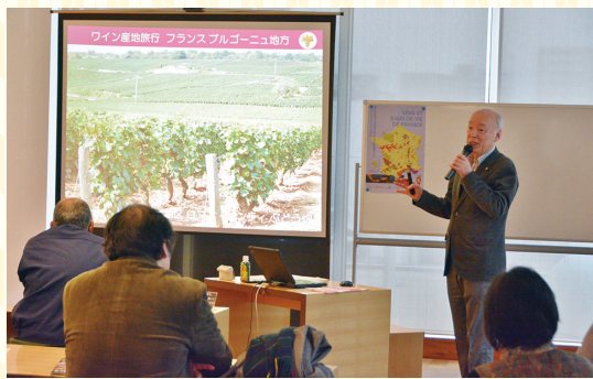
講師も市民、受講生も市民の「市民でつくる健康学部」