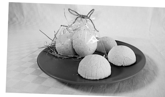
お風呂をシュワシュワにバスボム入浴剤作り