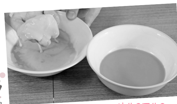
液体?固体? 片栗粉スライム作り