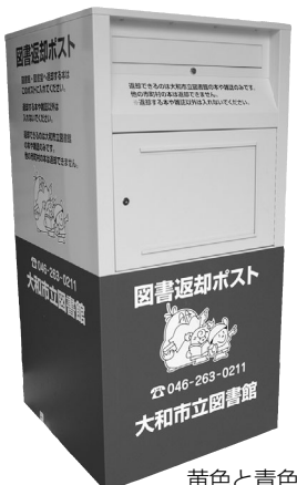
黄色と青色のポストです

■ 閩シリウス内図書館 ☎(263)0211 FAX(263)0404(市の所管はシリウス内市図書・学び交流課図書係) ☎(259)6105 FAX(263)6680