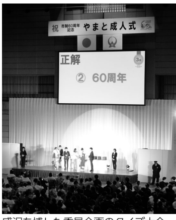
盛況を博した委員企画のクイズ大会

活動日程 ▼月2回程度(開催日は実行委員会決定) 対象/定員 ▼新成人：平成11年4月2日～同12年4月1日生まれ・次年度新成人：平成12年4月2日～同13年4月1日生まれの市内在住者/各5人程度 申し込み ▼4月26日(金)必着までに住所、氏名、電話番号、生年月日を記載し、ファクスまたは郵送