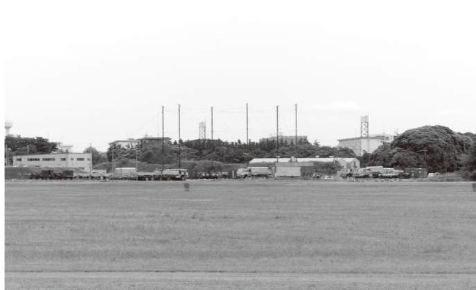
厚木基地内でのCBRN訓練のようす

リコプターや他基地から時折飛来する米軍ジェット戦闘機などの騒音が発生し、市民の日常生活に影響を及ぼしていることから、市では、引き続き厚木基地周辺の飛行状況や騒音の実態把握に努めるとともに、今後も国や米軍等に対し、市民が被る騒音被害の軽減を求めていきます。