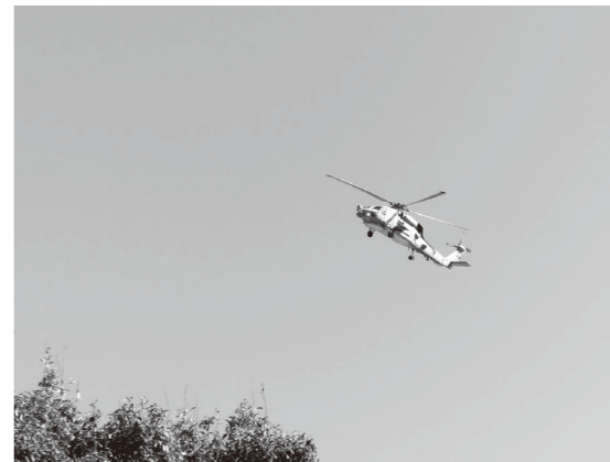
市内上空で周回飛行を繰り返すヘリコプター

今年2月から厚木基地で初めて実施された米本土の陸軍部隊による化学・生物・放射線および核(CBRN)訓練について、9月30日、国から同日までに終了したとの情報提供がありました。国からは、危険物などの持ち込みはなく、基地周辺に影響を与えるような騒音等は発生しない