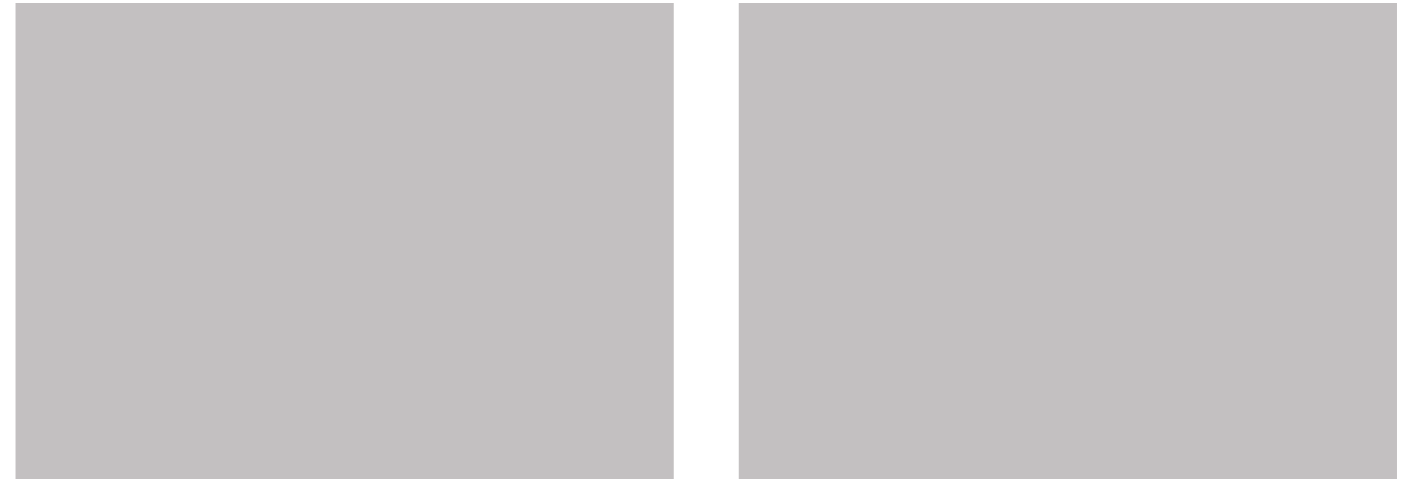
大和市は自主財源を確保するため、「広報やまと」に広告を掲載しています。