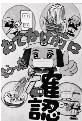
知念姫さんの作品