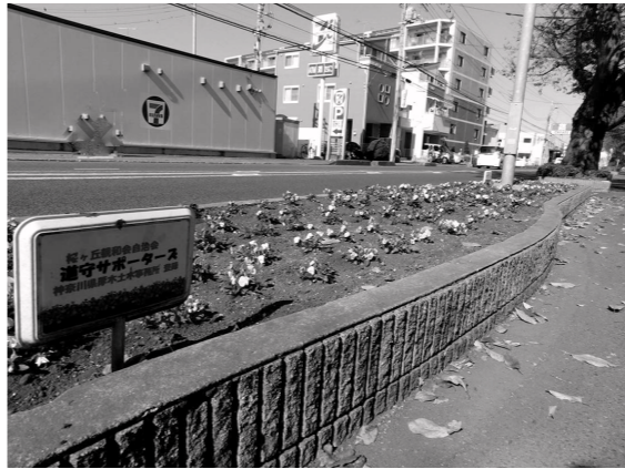
ボランティア団体が歩道にある花壇を整備

講評…工夫、努力、協力による花壇のお世話を通じたつながりを感じます。堅苦しくない運営で活動者が増やしていこうという姿勢や努力が見られます。それぞれの人たちの役割は緩やかですが、LINEなどを活用してしっかりとつながっており、地域みんなの居場所になっています。