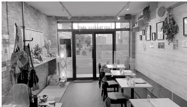
子どもからお年寄りまで幅広い年齢層の人が気軽に快適に楽しめる場を提供

講評…店内のバリアフリー化やキッズスペースの設置により、子ども連れから高齢の人まで誰もが利用