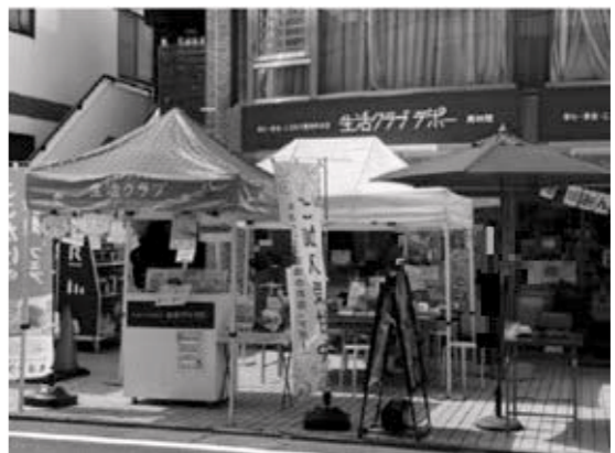
物販にとどまらない多様な活動を実施

孤立を防ぐために必要な場所の一つでしょう。 ●さがみ生活クラブ生活協同組合 南林間デポ(南林間)