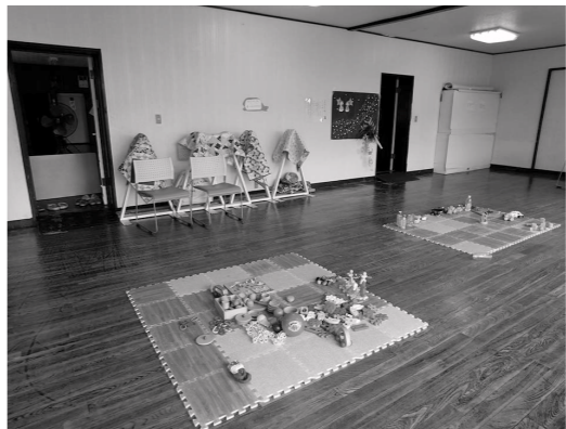
子育て中の人が自分らしく安心してほっとできる場を提供している

講評…子育て中の親子の出会い、交流の場になっています。資格を持つ人やボランティアが支えになり、誰かに相談できる場所があることは、子どもを育てているかたにとって重要です。幼稚園と隣接する教会の敷地内にあり、安心できる環境で、幅広いつながりの場として、