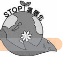
大和市気候非常事態宣言ロゴマーク

☎ 市役所環境総務課地球環境係 ☎ (260) 5493 FAX (260) 6281