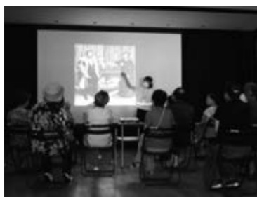
対話しながら作品の見方を深めます