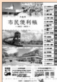
画像は2022・2023年度版です

市は、(株)サイネックスと協定を結び、日常生活に必要な各種手続きや行政サービスなどの情報を掲載する「大和市民便利帳2024・2025」(来年4月発行予定)を制作しています。同社が地域事業者の皆さんから募集する広告の掲載料により作成し、市内各戸と転入者に配布します。今後、便利帳に掲載する広告を募集しますので、ご協力をお願いします。便利帳への広告掲載の申し込みは同社横浜支店 ☎045(271)5580へ。