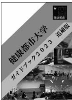
ガイドブックの表紙

シリウス内図書・学び交流課 健康都市大学係 ☎(259)6917 FAX(263)6680