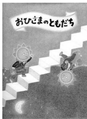
絵本大賞「おひさまのともだち」

やまと特別賞▼「おおきなき」(作・絵 いしいあやこ)。 ■入賞作品展示 とき▼3月1日(金)〜17日(日) 午前9時〜午後7時 ところ▼シリウス3階子ども図書館。