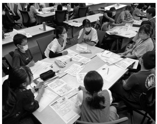
昨年の事後研修の様子