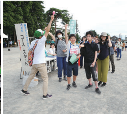
チームでゴールを目指します

申し込み ▼6月20日(木)午後5時(必着)までに希望コース(第2希望まで)、参加者全員の氏名・年齢(小学生～高校生は学校名も)、代表者(成人)の郵便番号・住所(市外在住者は勤務先も)・緊急時に連絡が取れる電話番号、車椅子使用者はその旨を記載し、直接またははがきで〒242-0018 深見西1-2-17 ベテルギウス内こども・青少年課へ。市のホームページから電子申請も可。 ※未就学児が参加するチームは、短い距離を推奨。車での来場不可。