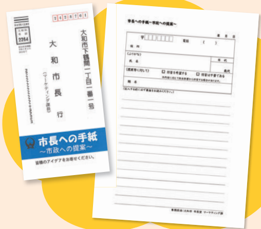
専用封筒は主な市の施設で配布しています (切手不要、任意の書式も可)