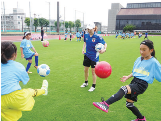
なでしこレジェンドから直接指導が受けられます

☎大和スポーツセンター内スポーツ課スポーツのまち推進係 ☎(260)5763 FAX(262)9514