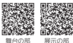
舞台の部 展示の部

申し込み▼①5月29日(金)、②6月12日(金)(いずれも必着)までに市のホームページから電子申請で。応募用紙を直接または郵送で〒242-8601市役所文化振興課へも可。公共施設に配架するほか、市のホームページからダウンロードもできます。 ※詳しくは募集要項をごらんください。