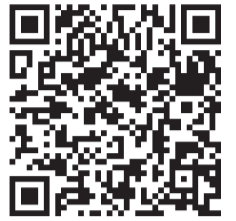
マイタイムラインの作り方

か分かりません。大和市でも水害への備えは重要であり、そのためにもマイタイムラインの作成をお願いいたします。また、強風による倒木等への備えとして、自宅の大きな樹木について、病気などにより枯れたり弱ったりしていないか、枝の伸び方が偏っていないかなどをチェックしてみてください。