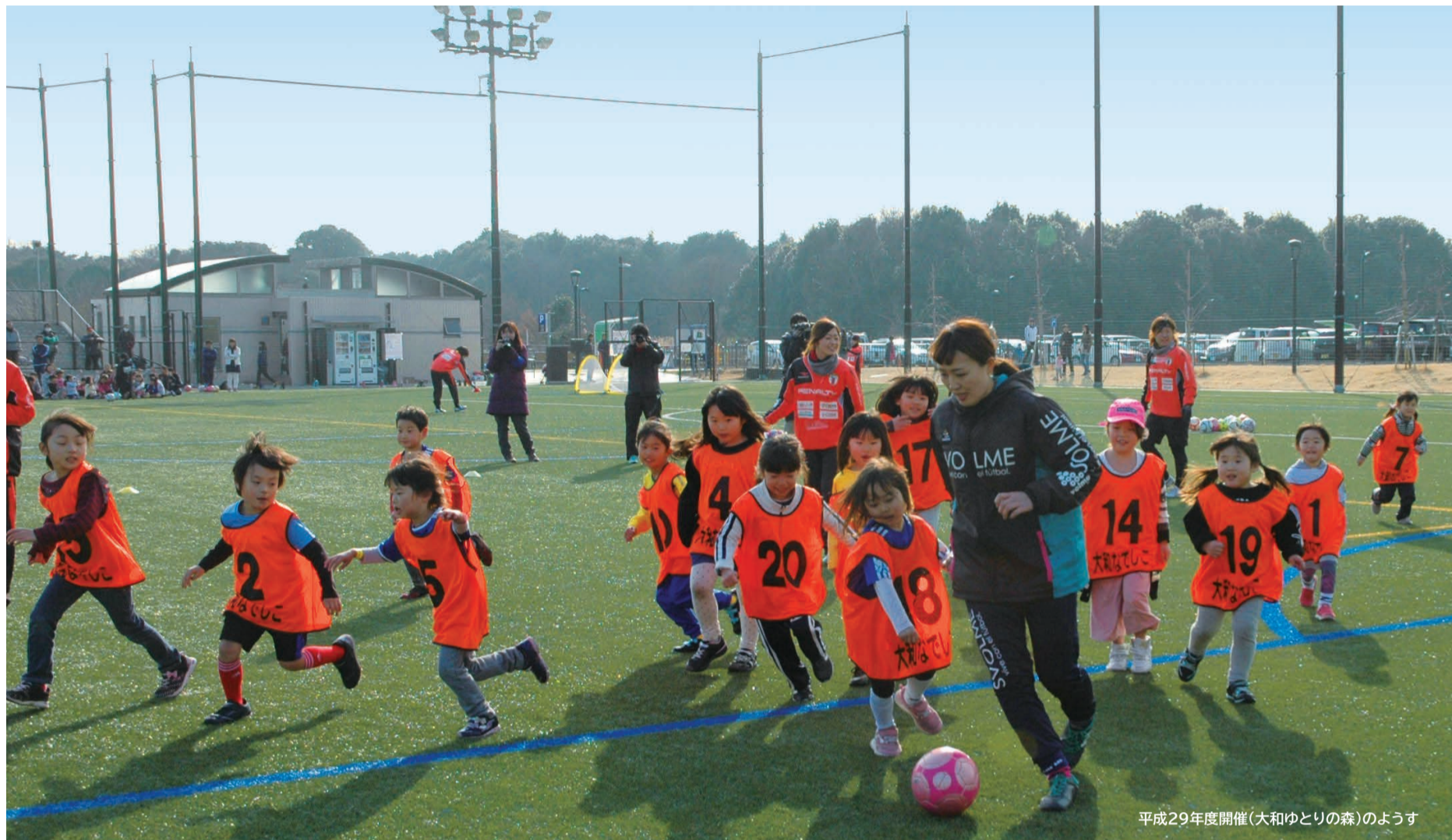
平成29年度開催(大和ゆりの森)のようす