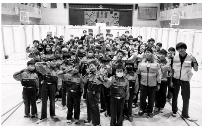
避難生活施設運営訓練にて

申し込み▼8月1日(火)〜31日(木)に入団申込書と健康調査票を直接市消防本部予防課へ。提出書類は7月21日(金)から同課で配布するほか、市のホームページからダウンロードも