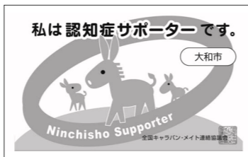
同講座の受講者に配付される「認知症サポーターカード」

対象▼いずれも市内在住・在勤者 定員▼①先着15人、②先着20人 講師▼地域包括支援センター職員 申し込み▼電話で①上草柳・中央地域包括支援センター☎(263)1108、②鶴間地域包括支援セン